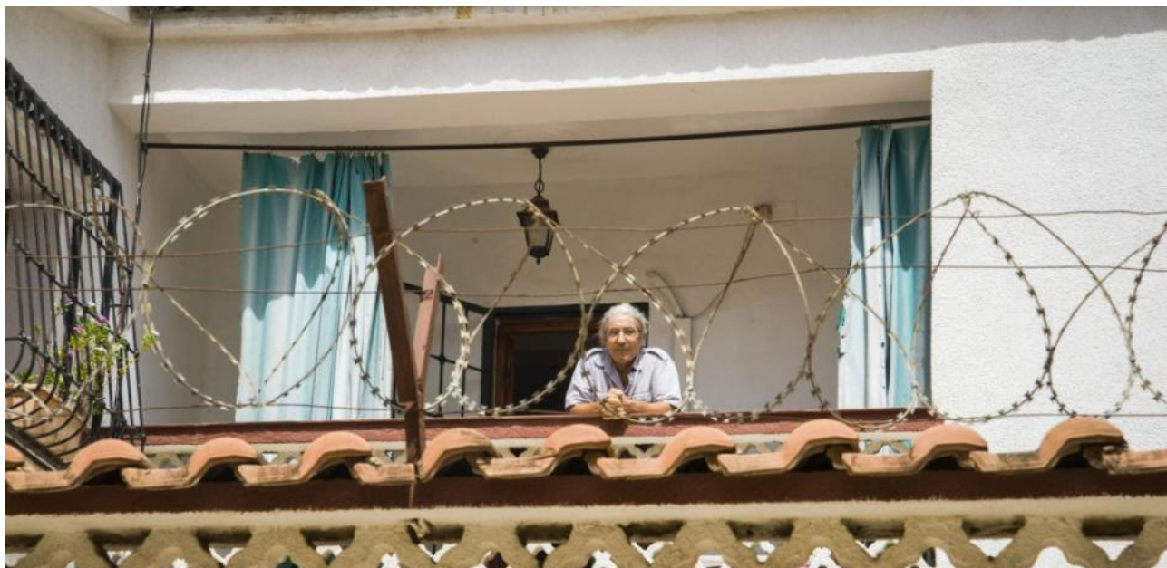
Boualem SANSAL chez lui, à BOUMERDES, en Kabylie

Avec "2084", le grand romancier algérien, qui vit reclus chez lui, publie une fable blasphématoire sur l'islamisme et l'état de son pays