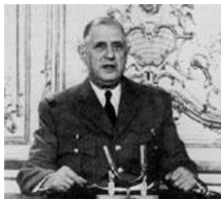
Dans le contexte de la guerre d'Algérie (1954-1962), ce virage marquait le début d'une politique de retrait.

Porté au pouvoir par les partisans de l'Algérie française en mai 1958, de GAULLE avait maintenu pendant un certain temps des positions équivoques sur le devenir politique d'un territoire déchiré par la guerre au risque d'entretenir des espoirs antagonistes. Depuis le commencement de l'année 1959, la pacification militaire s'est poursuivie en Algérie sous le commandement du général CHALLE. La mise en oeuvre du plan de développement économique et social, défini le 3 octobre 1958 à Constantine par le général de Gaulle, s'opère sous l'impulsion de M. Paul DELOUVRIER, Délégué général du gouvernement en Algérie. Mais aucun progrès n'a été accompli dans l'ordre d'une solution politique, la majorité des Européens d'Algérie réclamant « l'intégration », alors que les chefs de l'insurrection revendiquent « l'indépendance ». Il sortit de l'ambiguïté le 16 septembre 1959 à l'occasion d'un discours radiotélévisé par lequel il énonce le principe fondamental de sa politique à l'égard de l'Algérie : celui de l'autodétermination.